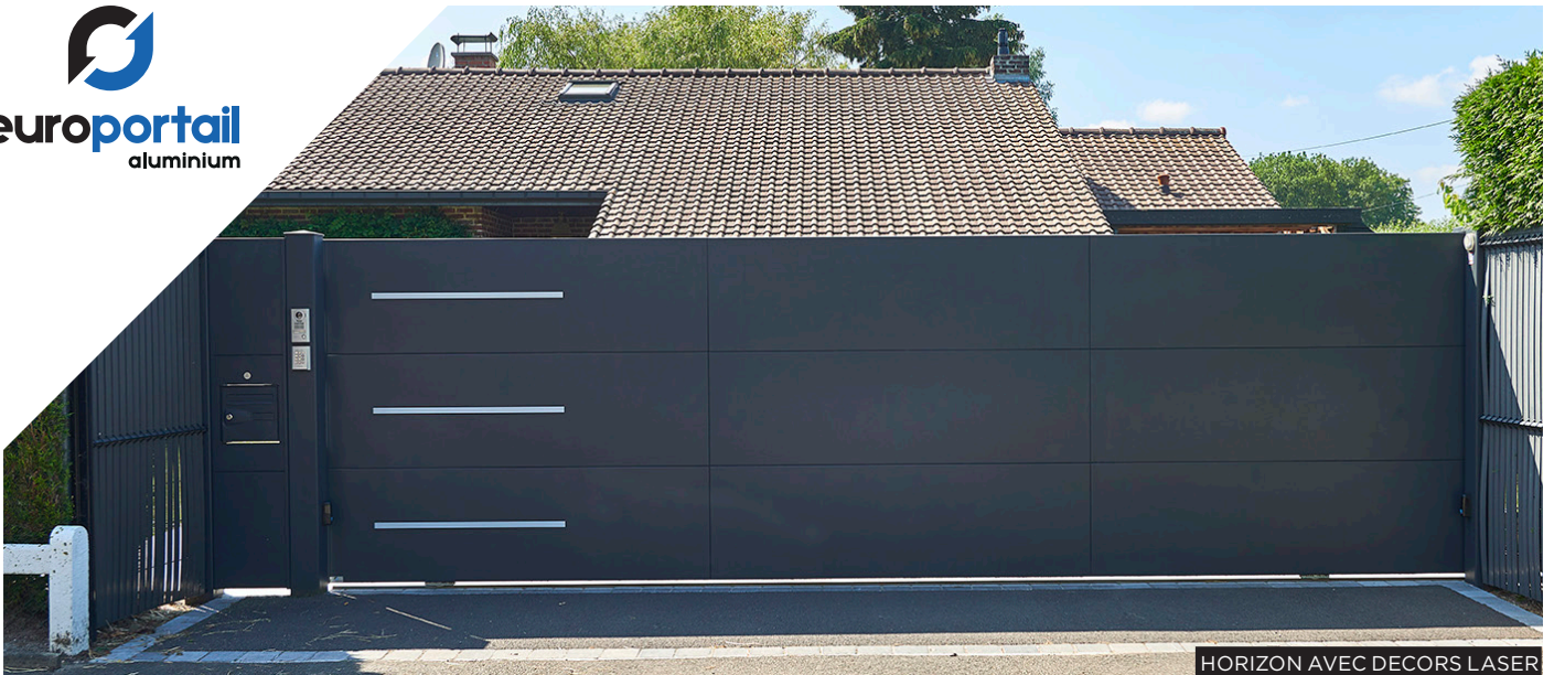
HORIZON AVEC DECORS LASER