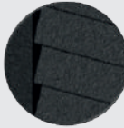
Lattes 80x20 inclinaées à 30°